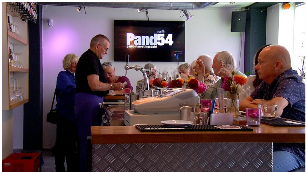
Roze Salon op de laatste donderdag van de maand

De woensdagmiddagen hebben een thematisch karakter waar allerlei onderwerpen worden besproken zoals eenzaamheid, rondkomen, acceptatie in de zorg, enzovoorts. De Roze salon op de donderdagmiddag is een gezellig ontmoetingscafé.