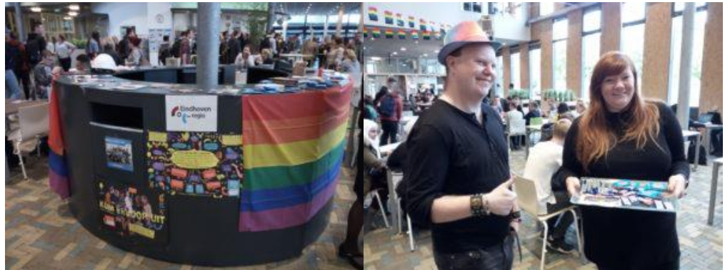
Op ROC ter AA stonden vrijwilligers van COC's jongerenteam

In de middag stonden we vervolgens bij de regenboogtunnel in Eindhoven om daar met voorbijgangers in gesprek te gaan over coming-out dag en de acceptatie en zichtbaarheid van de LHBTI-gemeenschap in Eindhoven en de regio.