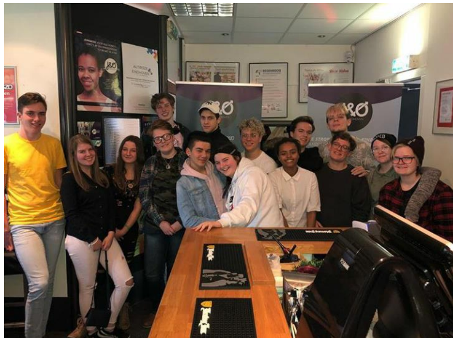
Jong en Out Eindhoven

Het Jong & Out team organiseerde 12 bijeenkomsten voor jongeren in de leeftijd van 12 t/m 18 jaar. In het najaar van 2017 zijn de bijeenkomsten vanwege toegenomen bezoekersaantallen verplaatst van de Tuinkamer naar de hoofdruimte van ons pand.