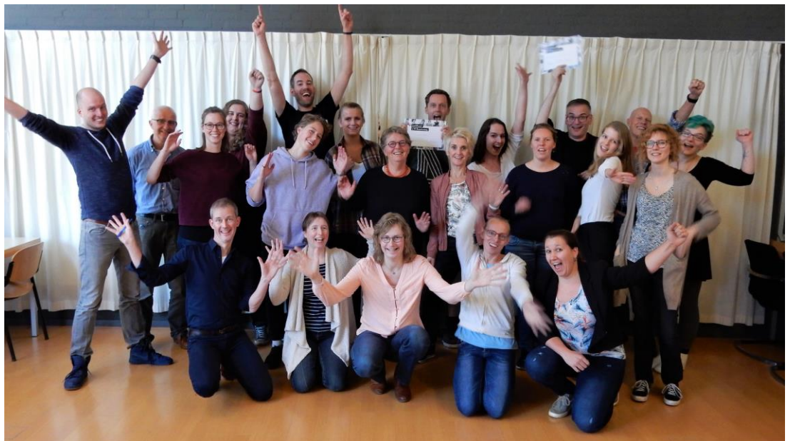
Voorlichters training van COC Nederland waar de voorlichters van COC Eindhoven en regio ook aan deelnamen.

COC Eindhoven en regio geeft voorlichting over seksuele- en genderdiversiteit. De meeste voorlichtingsactiviteiten spelen zich af op het voortgezet onderwijs waar ruim 4000 leerlingen en meer dan 200 docenten werden bereikt. Team voorlichting verzorgde in 2017 in totaal 210 voorlichtingslessen (2016: 204 2015: 163; 2014: 144) en onze voorlichters spendeerden in 2017 ruim 420 uur voor de klas (minimaal 2 en soms 3 voorlichters per voorlichting). Evaluatie van voorlichtingen door scholen en intervisie hebben een plaats gekregen in de interne organisatie van het voorlichtingsteam. COC Eindhoven en regio werkt samen met de gemeente Eindhoven en Helmond, de GGD Zuidoostbrabant en andere organisaties in het project seksuele- en genderdiversiteit van de gemeente Eindhoven en Helmond.