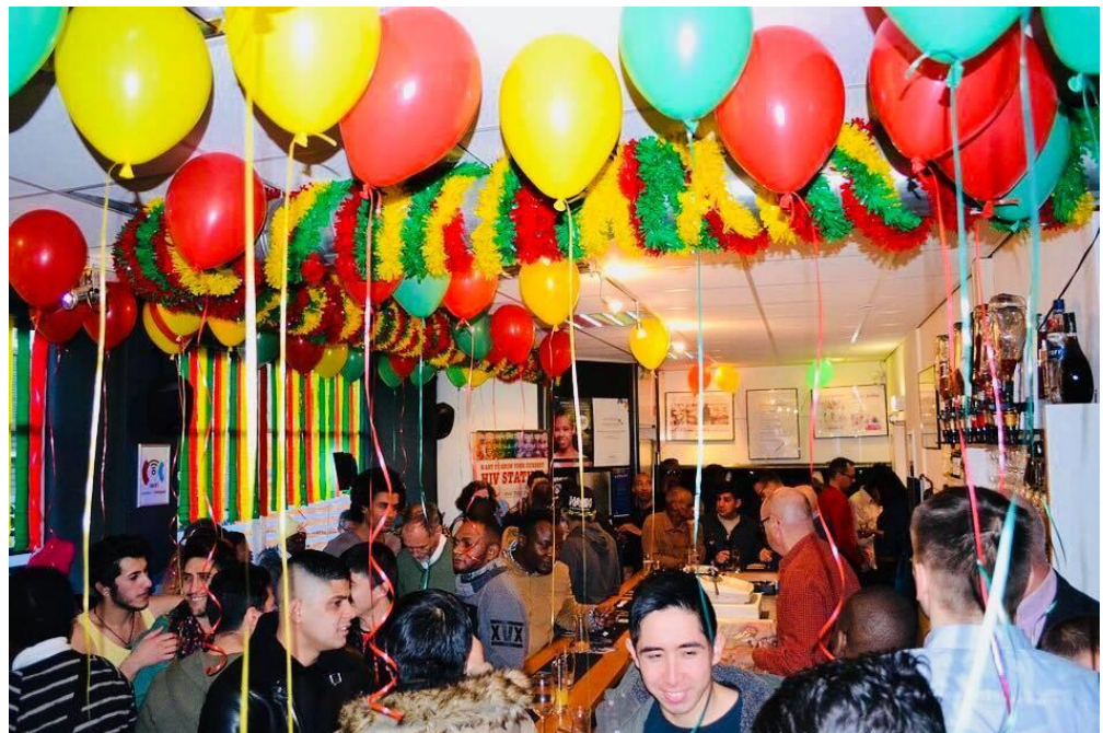
Eén van de drukbezochte maandelijkse bijeenkomsten.

In maart 2016 is het COCKtail project van COC Eindhoven en regio van start gegaan met als belangrijkste doel om LHBTI-vluchtelingen uit hun sociale isolement te halen. Ook in 2017 zijn we hier mee doorgedaan. Het COCKtail team staat in nauw contact met het Centraal Orgaan Asielzoekers (COA) en Stichting Vluchtelingenwerk. De Gay Refugee Walk-in (GRWI) inloopmiddag blijkt in een enorme behoefte te voorzien gezien het ongekend hoge aantal bezoekers iedere maand (150+ per maand). Naast de GRWI is er ook een maatjesproject waar tien LHBTI-vluchtelingen tijdelijk een maatje toegewezen hebben gekregen. In 2017 zijn er diverse projecten geweest. Zo is er meerdere keren de HIV-testbus van de Aids Healthcare Foundation langs geweest om Hiv-testen uit te voeren en is in november 2017 een SOA-preventiemiddag geweest met medewerking van de SOAIDS Nederland, de Aids Healthcare foundation, vluchtelingenorganisatie TamTam, GGD Amsterdam (Hepatitis-B injecties) en de GGD Zuidoost Brabant (ondersteunen van GGD Amsterdam).