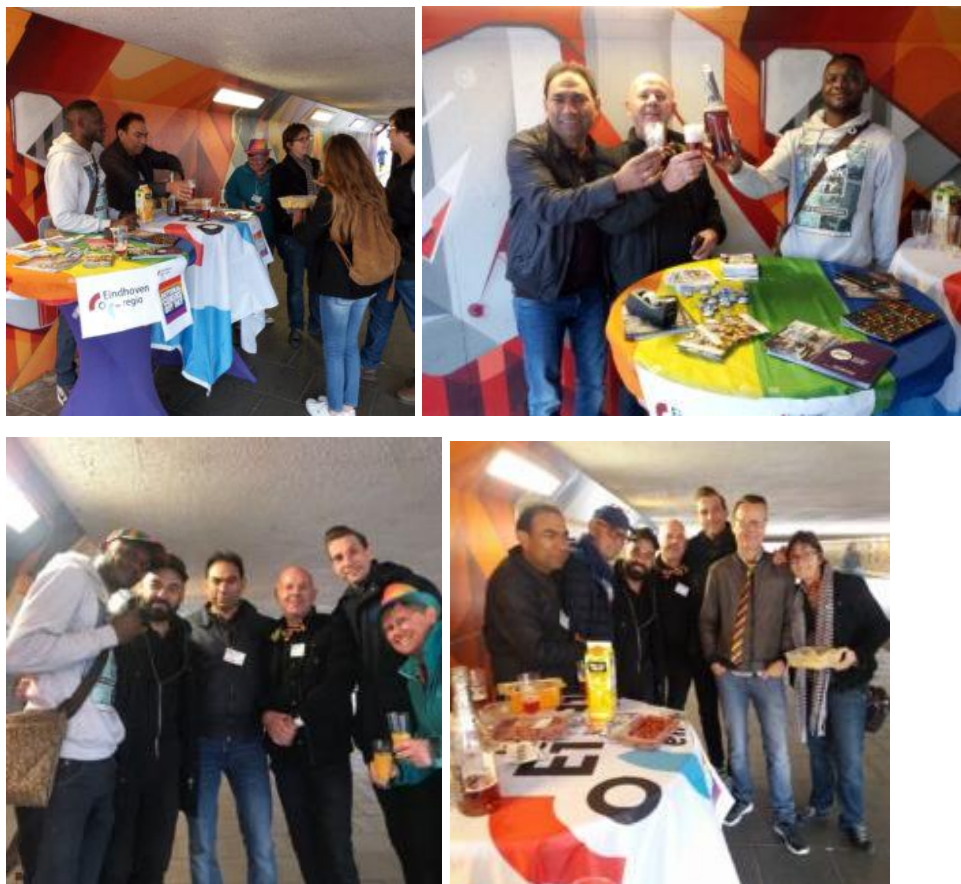
Het vrijwilligersteam deelde honderden flyers uit en ging in gesprek met voorbijgangers.

In de middag stonden we vervolgens bij de regenboogtunnel in Eindhoven om daar met voorbijgangers in gesprek te gaan over coming-out dag en de acceptatie en zichtbaarheid van de LHBTI-gemeenschap in Eindhoven en de regio.