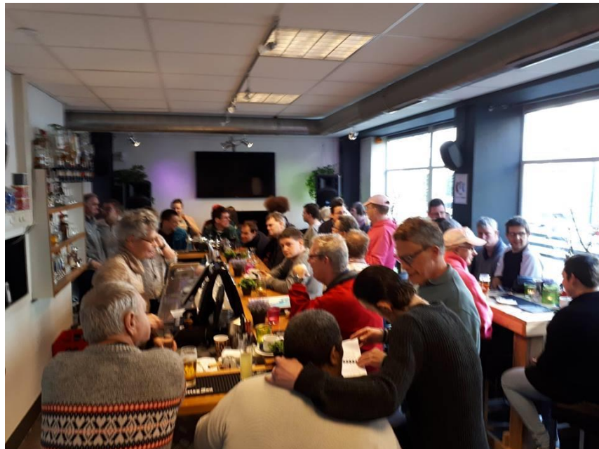
Drukbezochte Karaokemiddag tijdens de 'Anders Roze' soos